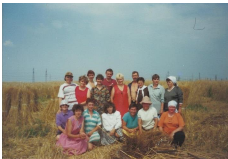
Заготовка расходных материалов для соломоплетения