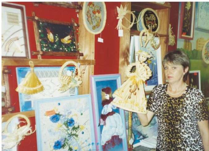
Коллекция выставочных работ (270 экземпляров)

Сделать – значит создать. Творение и создание – это выход из обыденного течения жизни, подъем на ступеньку выше, открытие в себе новых возможностей.